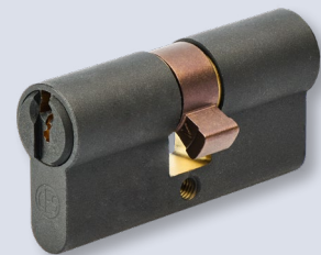
Vielfalt an Zylinderfärbungen