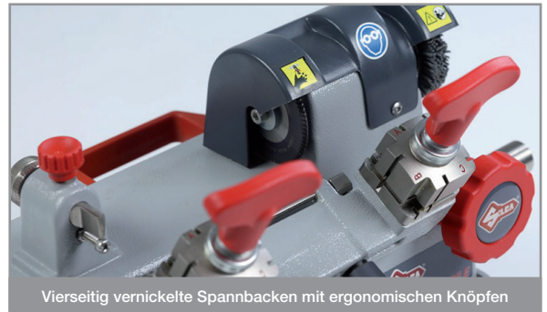
Vierseitig verstellte Spannbacken mit ergonomischen Knöpfen